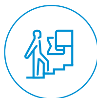
Performance e Sviluppo dei Personale