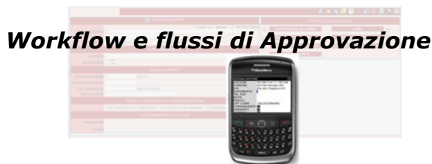
Workflow e flussi di Approvazione