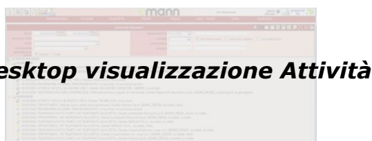
Desktop visualizzazione Attività