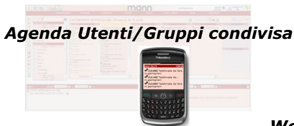
Agenda Utenti/Gruppi condivisa

La condivisione delle conoscenze del Cliente è requisito essenziale per una efficace gestione delle Attività Commerciali e più in generale per una più precisa e coordinata organizzazione delle Attività delle diverse Funzioni Aziendali.